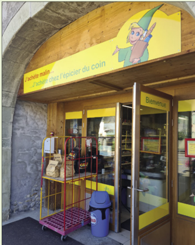
Commerce de proximité à Chancy Famille Cattan

Chemin de Champlong 50 - 1284 Chancy - Tél. 022 756 46 80